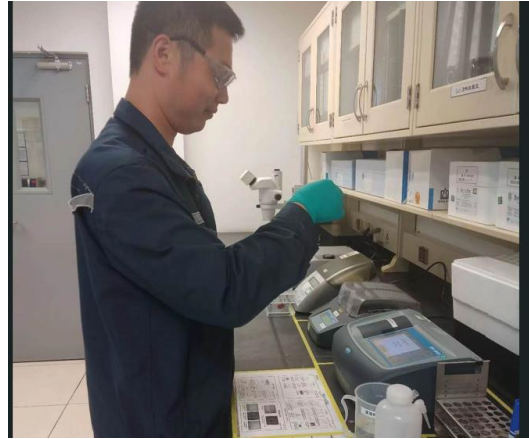
对雨水系统进行水质分析