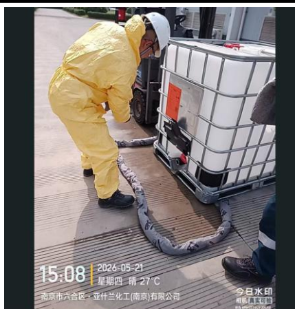
对泄漏点进行围围挡