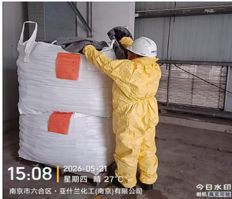
对清理物质危废入库